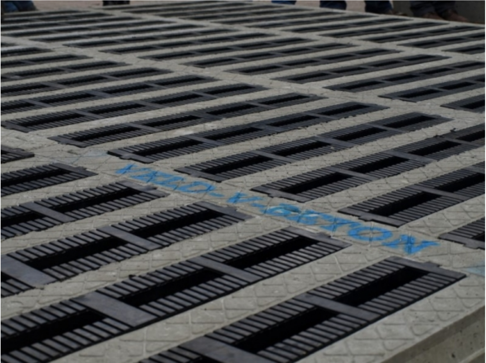
Vloer met rubberen toplaag voor extra koecomfort.

Nu fabrikanten en het ministerie van I&M overeenstemming hebben bereikt over de beoordeling van de meetrapporten, krijgen melkveehouders een ruimere keuze in de emissiearme vloer die ze aan kunnen schaffen.